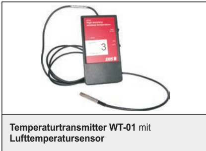
Temperaturtransmitter WT-01 mit Lufttemperatursensor

Temperatur (Pt100) - drahtlos (Art.-Nr. A033189)