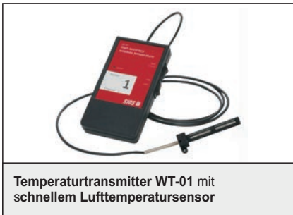
Temperaturtransmitter WT-01 mit schnellem Lufttemperatursensor