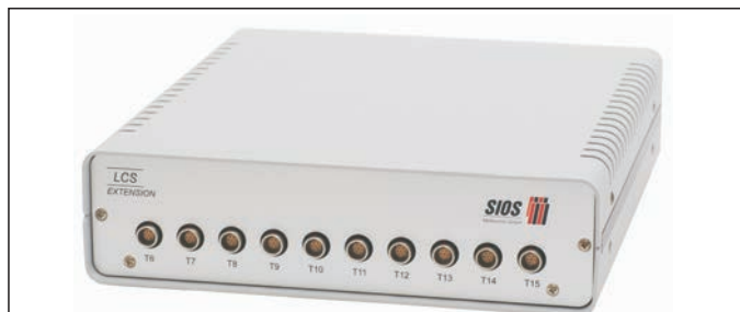
LCS-Extension (Artikel-Nr. A032612)