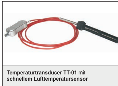
Temperaturtransducer TT-01 mit schnellem Lufttemperatursensor