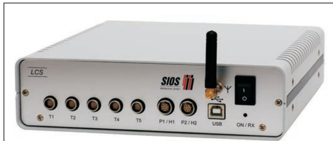
Klimamessstation LCS-01 mit Funk (Artikel-Nr. A032123) Klimamessstation LCS-02 ohne Funk (Artikel-Nr. A032124)