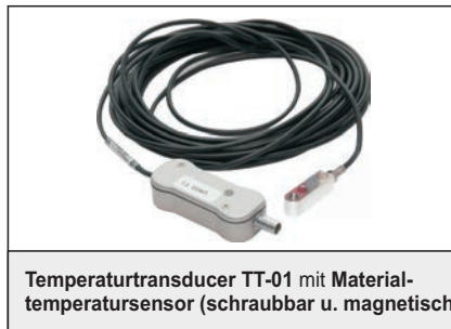
Temperaturtransducer TT-01 mit Materialtemperatursensor (schraubbar u. magnetisch)