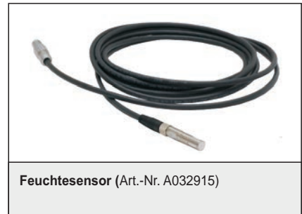
Feuchtesensor (Art.-Nr. A032915)