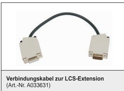
Verbindungskabel zur LCS-Extension (Art.-Nr. A033631)