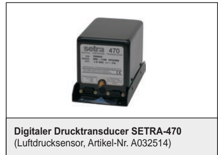
Digitale Drucktransducer SETRA-470 (Luftdrucksensor, Artikel-Nr. A032514)