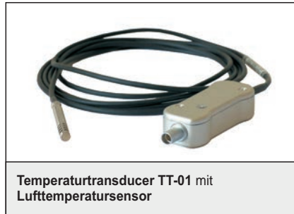
Temperaturtransducer TT-01 mit Lufttemperatursensor

Temperatur (Pt100) - drahtgebunden (Art.-Nr. A033188)