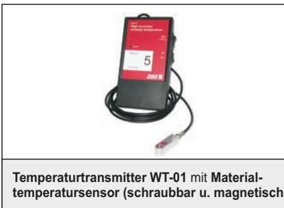
Temperaturtransmitter WT-01 mit Materialtemperatursensor (schraubbar u. magnetisch)