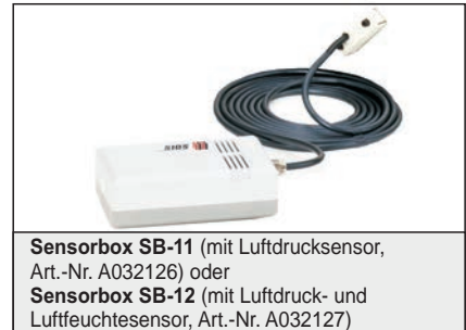
Sensorbox SB-11 (mit Luftdrucksensor, Art.-Nr. A032126) oder Sensorbox SB-12 (mit Luftdruck- und Luftfeuchtesensor, Art.-Nr. A032127)