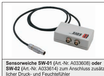
Sensorweiche SW-01 (Art.-Nr. A033608) oder SW-02 (Art.-Nr. A033614) zum Anschluss zusätzlicher Druck- und Feuchtefühler